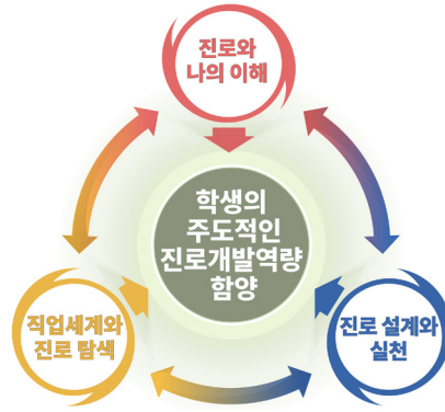
[그림 3] 2022 개정 「진로와 직업」 교육과정의 구성