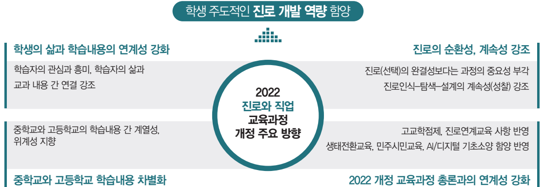
[그림 1] 2022 개정 「진로와 직업」 교육과정의 주요 개정 방향